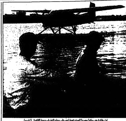
أول طائرة جويّة صينية الصنع تهبط على سطح التلّي في رسد لتفاحة

أشارت وزارة الاقتصاد الإيرانية إلى أن إجمالي الدينون الخارجية لمصر في نهاية عام 1997 بلغ 22,1 مليار دولار. وقالت الوزارة إن الدينون الخارجية لمصر في نهاية عام 1997 بلغت 22,1 مليار دولار. وقالت الوزارة إن الدينون الخارجية لمصر في نهاية عام 1997 بلغت 22,1 مليار دولار.